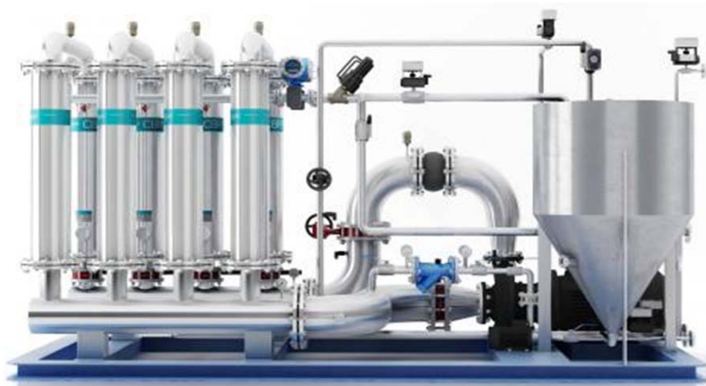
Ammonia Nitrogen Removal system

LH-ANR 시스템은 암모니아성질소 특수 멤브레인을 이용하여 NH 3 탈기방식과 동일한 원리 즉 A.L.E Chaterlier법의 원리로 화학평형 상태에서 반응물 또는 생성물의 양이 변하여도 또 다른 화학평형에 도달하게 된다는 법칙"을 응용하여 수중NH 3 을 H 2 SO 4 용액을 이용하여 (NH 4 ) 2 SO 4 를 형성 배출시키는방법으로 중/고농도의 암모니아 제거(90%)에 아주 효율적입니다